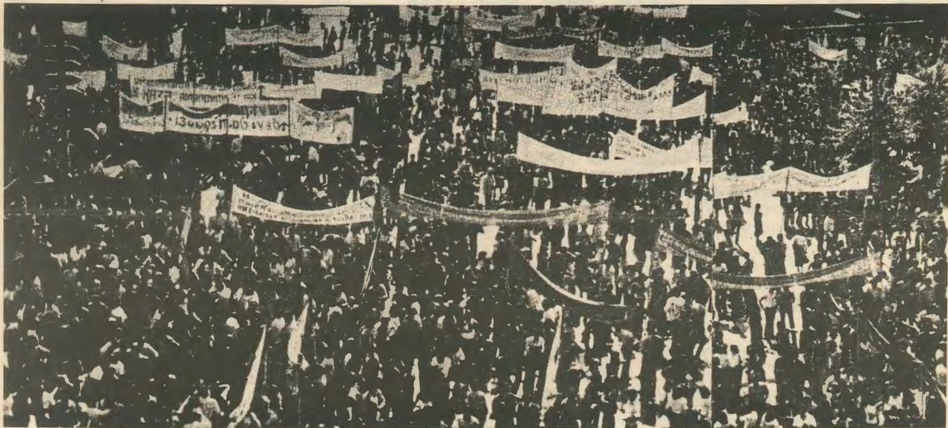
Από τη συγκέντρωση στις 4 Μάη '78 στο Πεδίον του Άρεως για τον γιορτασμό της πρωτομαγιάς.

πό την εκστρατεία της δεξιάς για δήθεν «επικείμενη σύμπτυξη λαϊκού μετώπου» και για να κερδίσει ίσως την λαϊκή βάση του υπό διάλυση Κέντρου, ανακοίνωσε ότι «Το ΠΑΣΟΚ κατέδραμε αυτότελες στις εκλογές του 1977 με δικό του κυβερνητικό πρόγραμμα. Και στις επόμενες εκλογές θα κατεβεί αυτότελες, με δικό του βελτιωμένο πρόγραμμα για την μεγάλη αλλαγή στην χώρα μας». Αφησε όμως ανοικτό το δρόμο για επί μέρους συν-